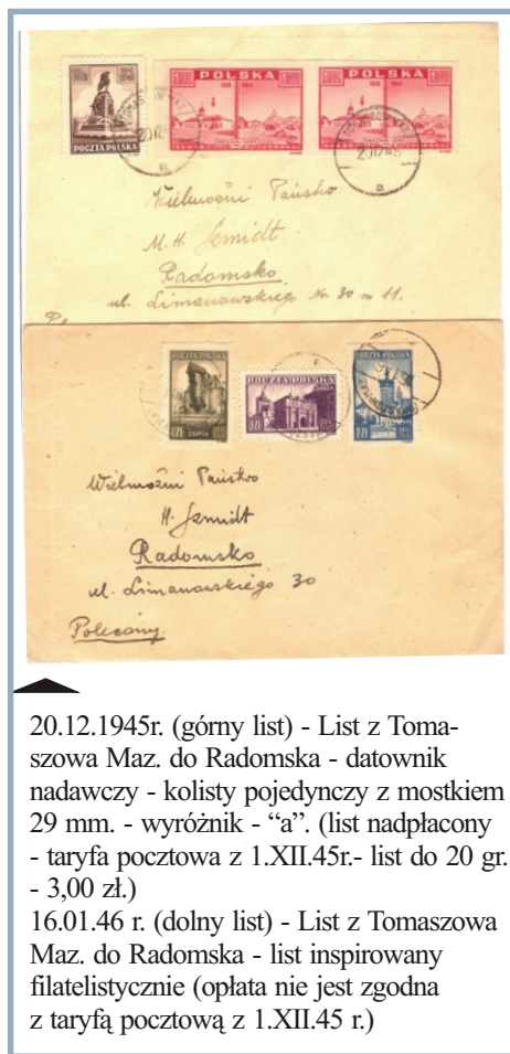
20.12.1945r. (górný list) - List z Tomaszowa Maz. do Radomska - datownik nadawczy - kolisty pojedynczy z mostkiem 29 mm. - wyróżnik - "a". (list nadpłacony - taryfa pocztowa z 1.XII.45r.- list do 20 gr. - 3,00 zł.) 16.01.46 r. (dolny list) - List z Tomaszowa Maz. do Radomska - list inspirowany filatelistycznie (opłata nie jest zgodna z taryfą pocztową z 1.XII.45 r.)