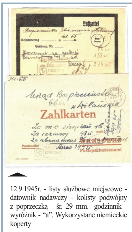
12.9.1945r. - listy służbowe miejscowe - datownik nadawczy - kolisty podwójny z poprzeczką - śr. 29 mm.- godzinnik - wyróżnik - "a". Wykorzystane niemieckie koperty